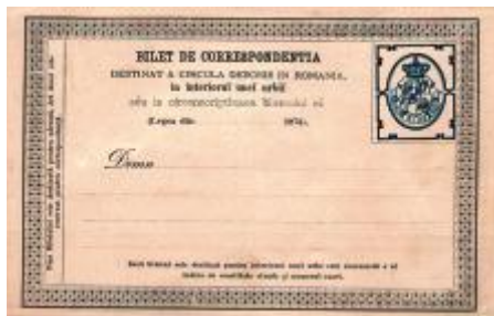
BILET DE CORESPONDENȚĂ DESTINAT A CIRCULA DESCHIS ÎN ROMÂNIA în interiorul unei urbi. Marca fixă fără valoare specificată. UNICAT