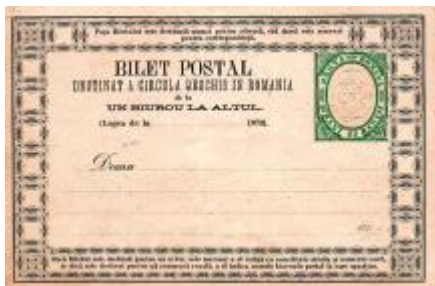
BILET POSTAL DESTINAT A CIRCULA DESCHIS ÎN ROMÂNIA. Marca fixă cu valoarea de 25 BANI. UNICAT