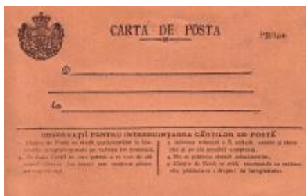
Probă pentru prima carte poștală românească, 1873. Fără imprimarea mărcii fixe. Proba nu a fost acceptată. UNICAT