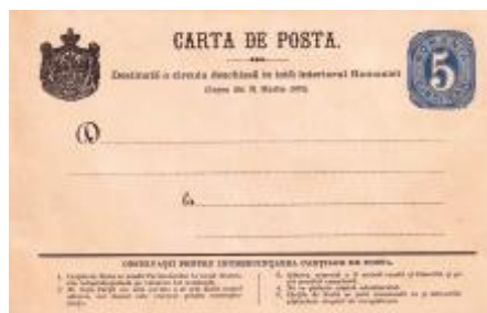
Eseu pentru prima carte poștală românească, 1873. A fost acceptată cu modificarea mărcii fixe, a tipului de ornament și a stemei.